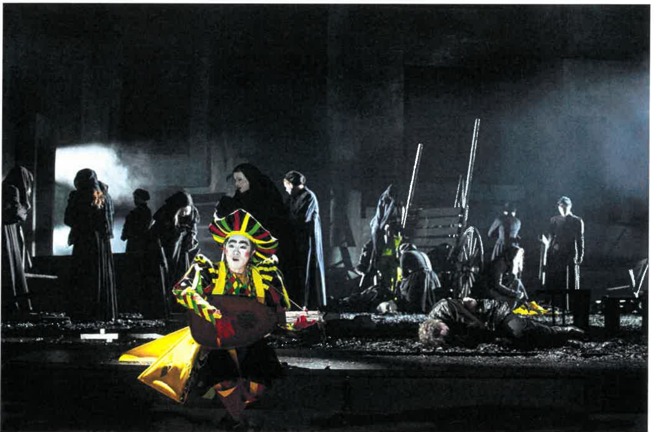
Fra Den Jyske Operas opførelse af Michael Koolhaas, 2019

indgået mellem Den Jyske Opera, Aarhus Kommune og Slots- og Kulturstyrelsen